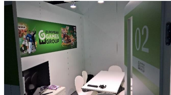
Impressionen von 2015 und 2016