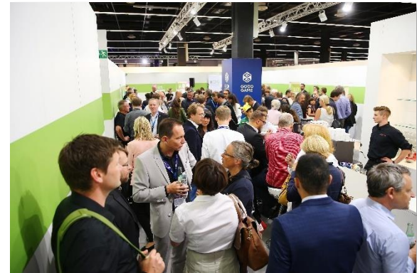
Impressionen von 2015 und 2016