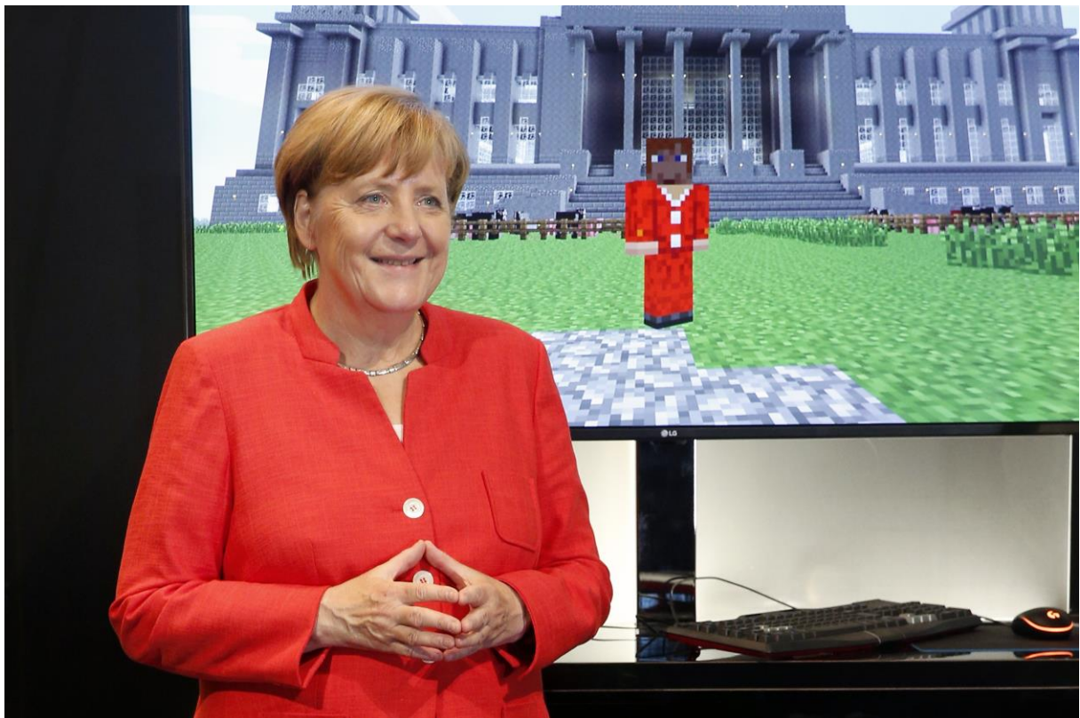
Bundeskanzlerin Angela Merkel lässt sich auf der gamescom 2017 die „Minecraft Education Edition“ zeigen.