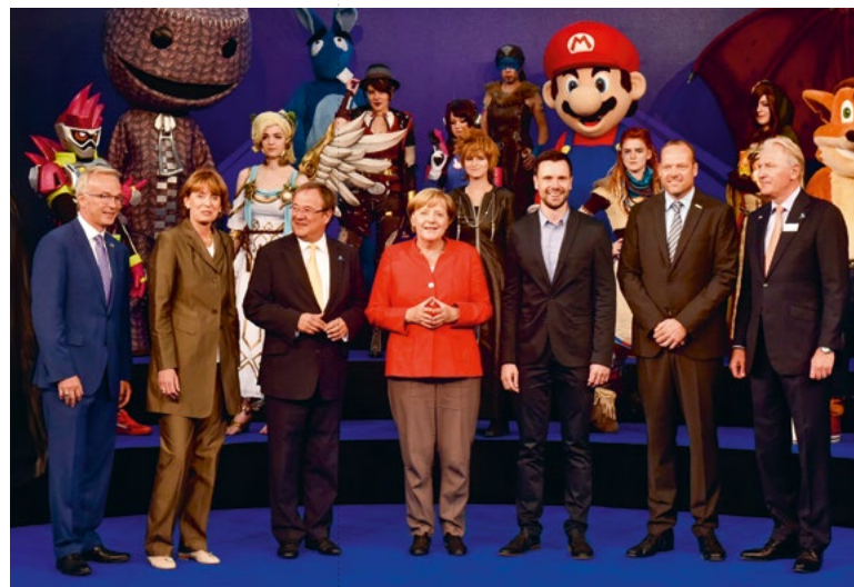
Bundeskanzlerin Dr. Angela Merkel eröffnet die gamescom 2017.