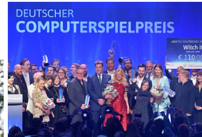
Die Gewinner und Laudatoren des Deutschen Computerspielpreises 2018.